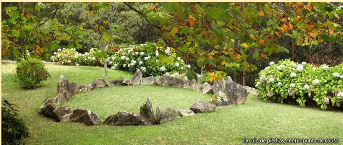
círculo de piedras, centro punta de couso