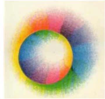
Portada del libro "Mundo, color y hombre" de Julius Hebing